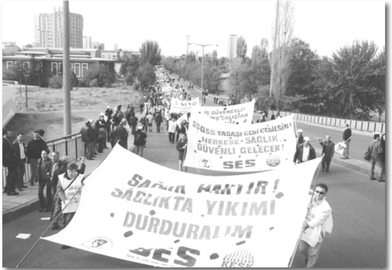
Sendikal ihanet barikadı

Basına yansıdığı kadarıyla yeni taslakta da hükümetin meseleye bakışı değişmiş değil. Bunun yerine taslağa Anayasa Mahkemesi’nin itiraz gerekçelerini ortadan kaldırmaya dönük bazı biçimsel düzenlemeler eklenmiş durumda. Örneğin halen